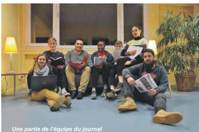
Une partie de l'équipe du journal